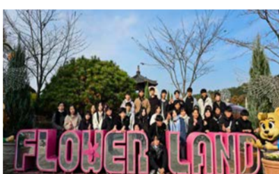
정수중 학생들이 마을 연계 생태환경 체험학습에 참여하고 있다.

이어 20일에는 대전 오월드의 플라워랜드와 버드랜드에서 체험학습의 기회를 갖고 인공생태계 속에서의 환경, 식물, 동물을 관찰했다. 구흥서 교장은 "학생들이 야외