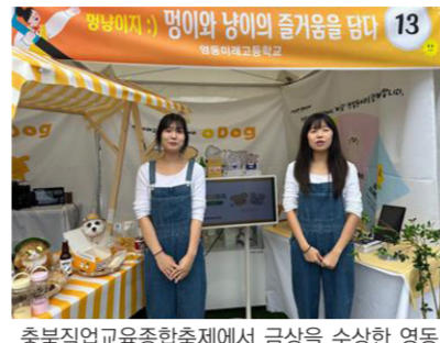
충북직업교육종합축제에서 금상을 수상한 영동미래고 창업동아리 멍냥이지.

리와 11개의 비즈쿨 동아리를 운영하고 있으며, 그중 '멍냥이지'와 '바오담' 동아리가 학교를 대표하여 이