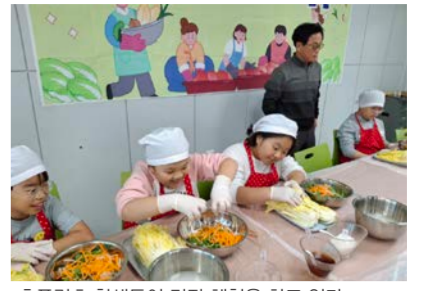
추풍령초 학생들이 김장 체험을 하고 있다.

추풍령초등학교는 21일 학생들을 대상으로 전통 식문화 계승 조리 실습 '김장하는 날'을 운영했다. 우리나라 전통음식인 김치 중 백김치를 직접 만들어보며 한국의 전통문화인 김장을 체험하고 우리 음식의 소중함을 느껴보기 위해 마련했다.