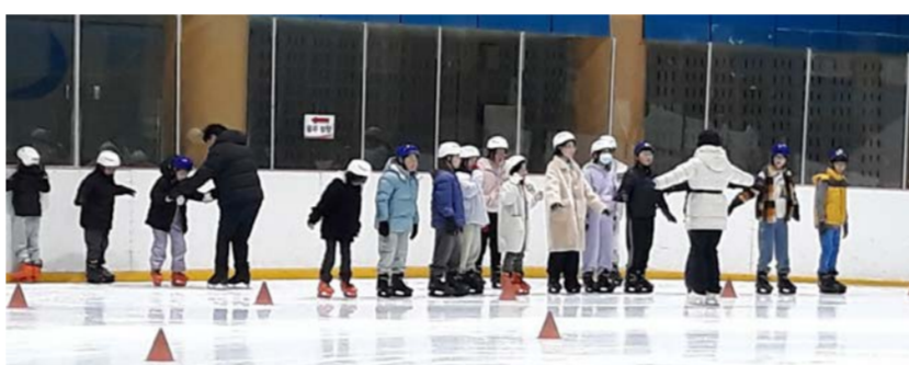
매곡초 학생들이 대전에서 계절스포츠 체험을 하고 있다.

매곡초등학교는 21일 대전 남선체육관 스케이트장에서 매곡초, 상촌초 학생들이 참여하는 작은학교 공동교육과정 계절스포츠 체험교육을 실시했다.