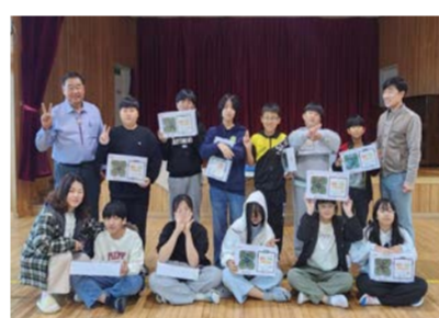
정수중이 구룡초와 함께 공동으로 맞춤형 드론 교육을 하고 있다.