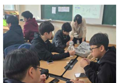
새너울중이 진로캠프를 운영하고 있다.

이번 행사는 학생들에게 우리의 전통 식문화에 대한 지식과 우수성을 인식시키고 전통식 문화를 계승하고 발전시킬 수 있도록 돕는 소중한 시간이 됐다.