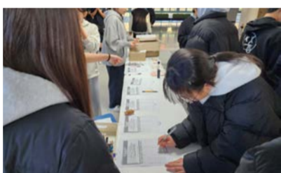
새너울중이 사과와 화해로 지우는 학교폭력 운영.

는 "이번 행사를 통해 학생들이 학교폭력의 심각성을 인지하고, 화해와 용서를 통해 폭력이 없는 행복한 학교생활을 할 수 있기를 기대한다"고 전했다.